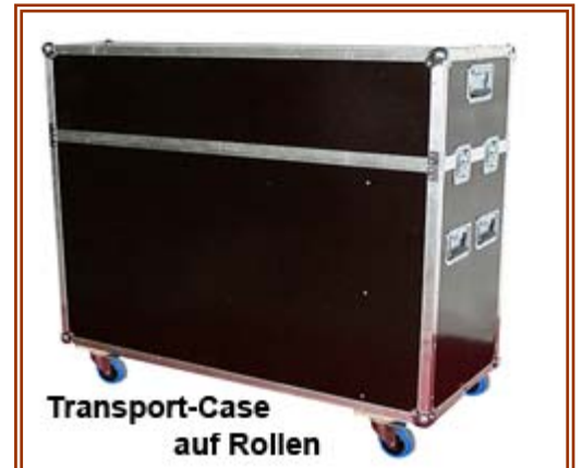
Transport-Case auf Rollen