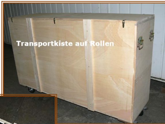
Transportkiste auf Rollen