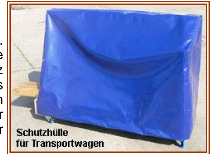
Schutzhülle für Transportwagen